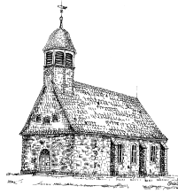
Kirche Alt Wallmoden

(Ev. Jugend Alt Wallmoden/ Upen/Ringelheim) Goslarsche Str. 38 38259 Ringelheim Tel.: 05341 / 33295 Fax.: 8335015 Mail: Karsten@ejwau.de Webseite: www.ejwau.de